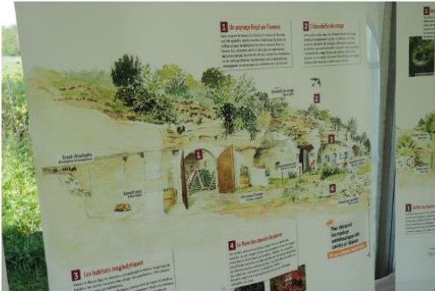
Exposition itinérante des ENS du Département touraine